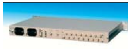
Professioneller Sat-ZF-Verteiler von DEV: Vorderseite (links), Rückseite (rechts).

Der Autor ist Geschäftsführer der DEV Systemtechnik GmbH & Co. KG.